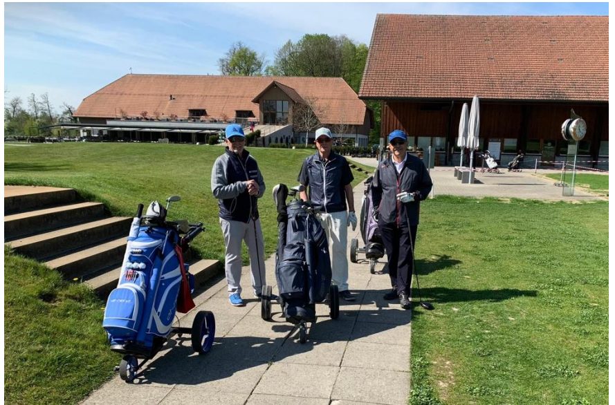
Freude pur vor dem ersten Drive!

Es herrschen noch Winterrules, die Plätze sind jedoch bereits in einem sehr guten Zustand.