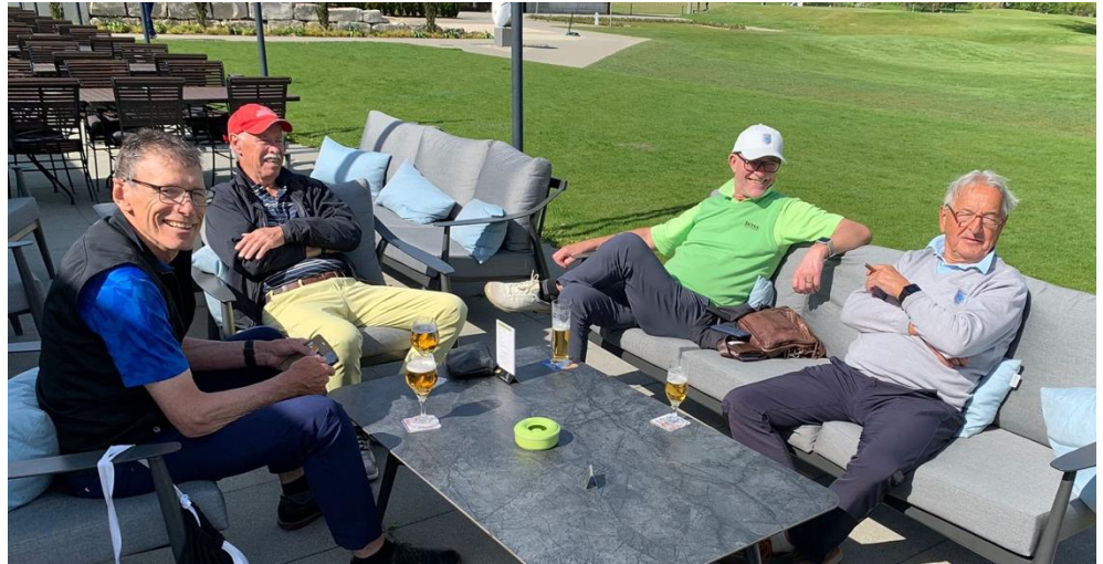
Gemütliches Apéro nach der Runde